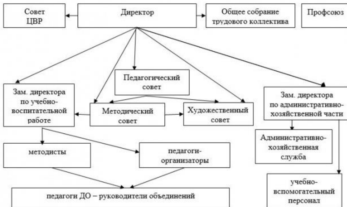
Рис. 1 – Структура МУДО ЦВР.

Управление Учреждением осуществляется в соответствии с законодательством Российской Федерации с учетом особенностей, установленных законодательством об образовании и настоящим Уставом, на основе сочетания принципов единоначалия и коллегиальности (рис.1).